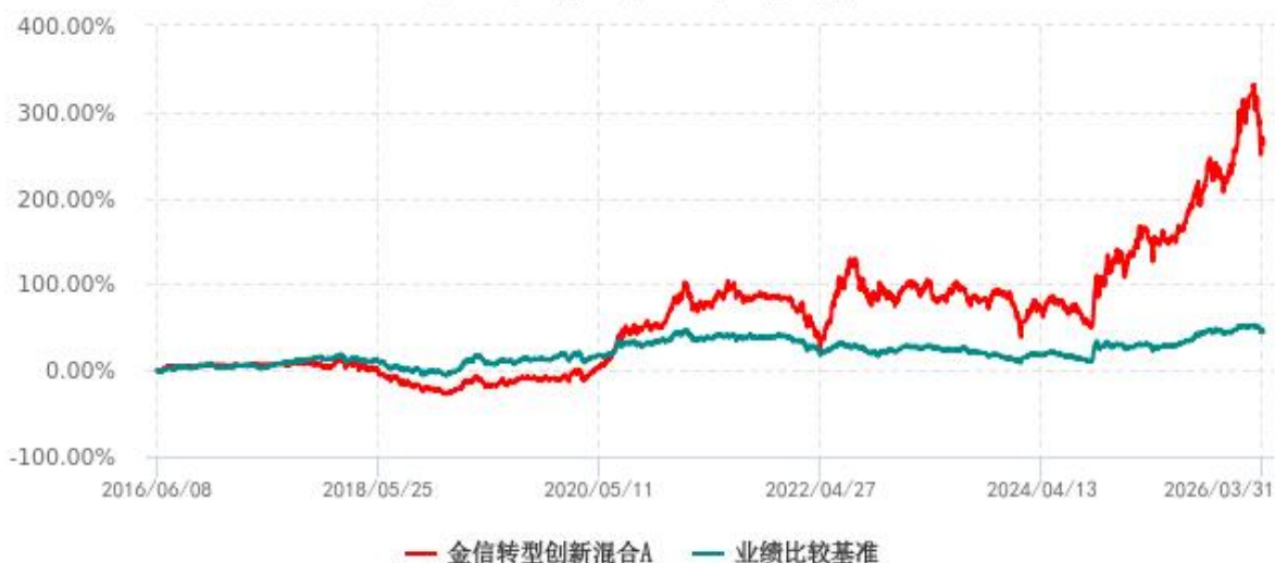
金信转型创新混合A累计净值增长率与业绩比较基准收益率历史走势对比图 (2016年06月08日-2026年03月31日)